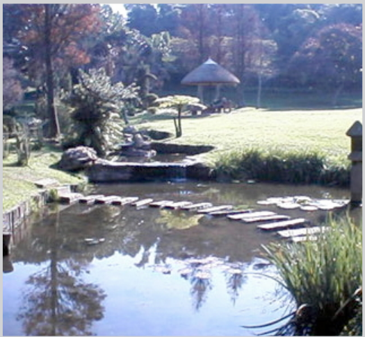
عن لوفيفارو الفرنسية