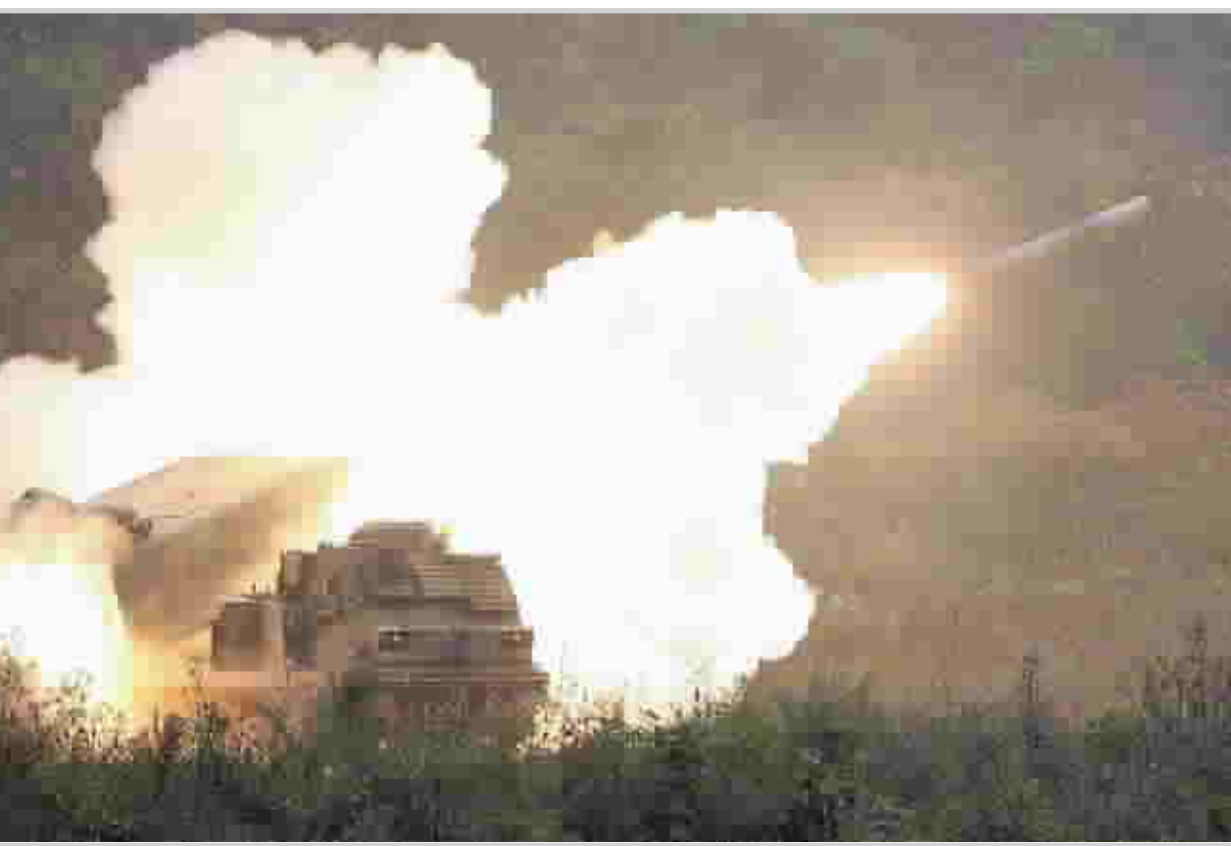
صاروخ امريكي ينطلق من قاذفة امريكية في كوريا الجنوبية

وقال المتحدث باسم البيت الابيض توني سنو "نسمع كلاما مضاه ان الصينيين يعاينون الاشياء التي تعبر حدودهم". واذاف امام الصحافيين "يبدو انهم يفتشون". يأتي هذا بعد ان حذرت الوكالة الدولية للطاقة الذرية من ان ٣٠ دولة قد تطور سلاحا نوويا في حال لم يتم وقف انتشار التكنولوجيا النووية. وقال رئيس الوكالة محمد البرادعي ان ثمة "اغراءات" للدول في ان تطور الاسلحة النووية، واذاف البرادعي في مؤتمر حضره في العاصمة النمساوية فيينا مقر الوكالة ان ما بين ٢٠٠١ وال٣٠٠٠ دولة لديها القدرة على تطوير اسلحة نووية خلال فترة زمنية قصيرة جدا".