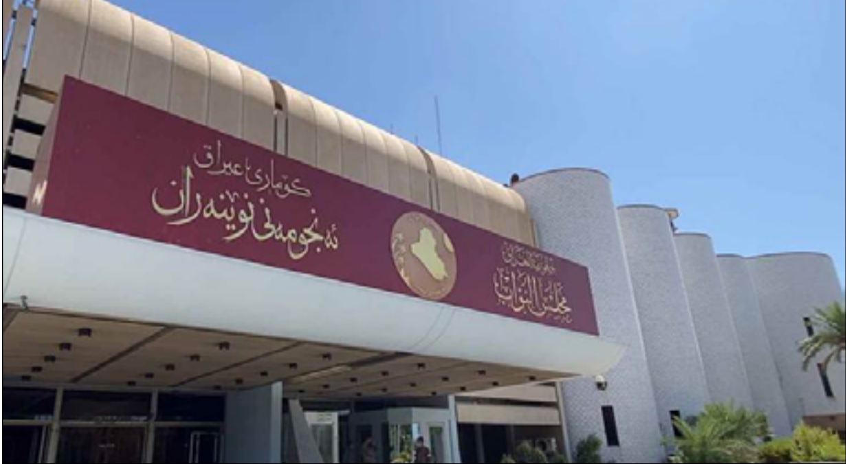
مبنى البرلمان في المنطقة الخضراء

ونلك مسموح وفق ما نص عليه قانون الإدارة المالية رقم 6 لسنة 2019 المعدل". وأكد، أن "الجديد الذي حصل هو جعل هذه الموازنة لثلاث سنوات"، مشدداً على أن "هذا الإجراء يتم اتخاذه لأول مرة بعد عام 2003،