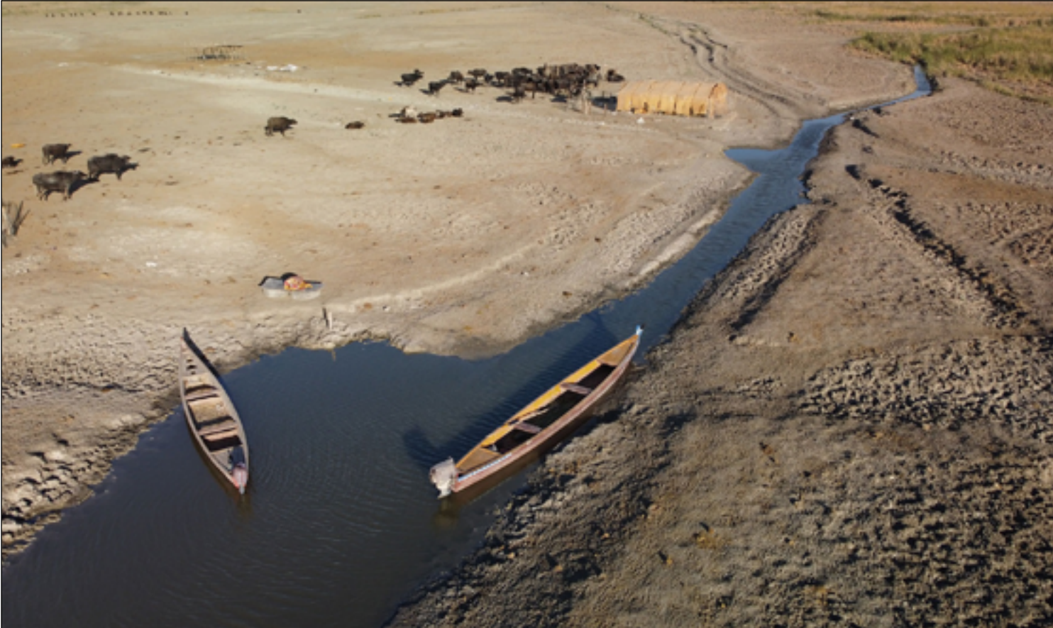
توقعات بانحسار كبير لمياه الأهوار في الصيف المقبل

العالم وقد تكون لها عواقب وخيمة على البلاد".