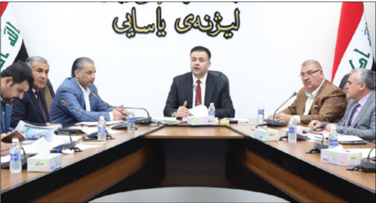
من اجتماعات اللجنة القانونية بشأن الانتخابات المحلية

بصيغة ١,٦، اما المستقلون والقوى الناشئة تريد بقاءه بنظام الدوائر المتعددة".