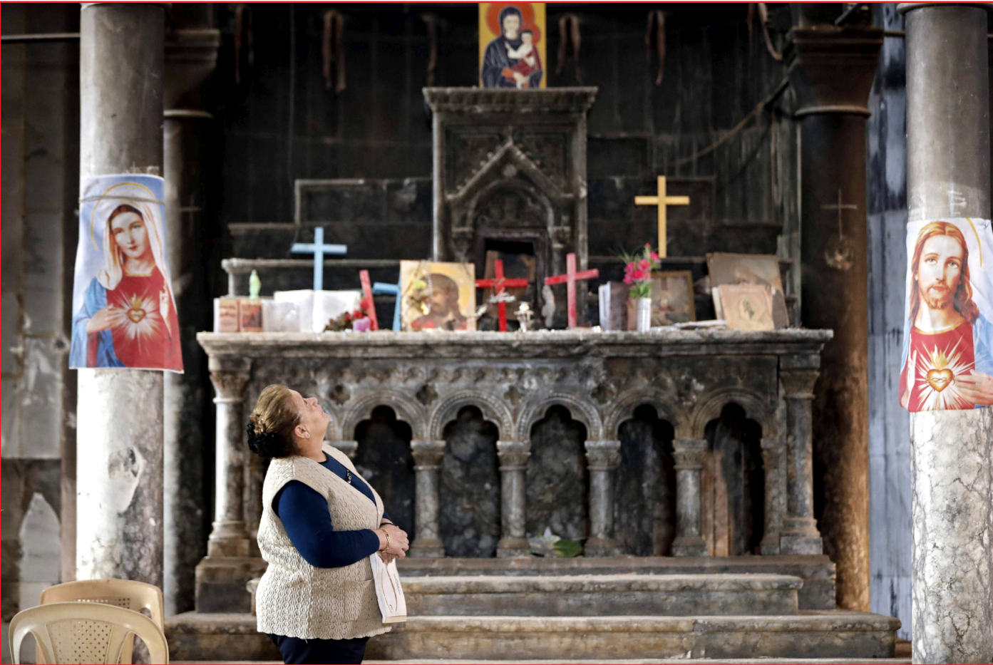
سيّدة من قره قوش تزور كنيسة المدينة بعد شهر من تحريرها.. أ. ف. ب