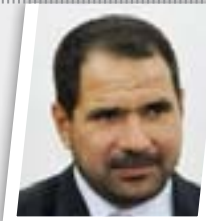
لم نناقش استجواب "زيدان" داخل لجنة الزراعة

وأضاف النائب الكردي ان "رواتب الرعاية الاجتماعية غير مشمولة وكذلك المتقاعدين"، مشيراً الى ان "الكتل الكردستانية كانت قد اقترحت ان يكون نصيب الحكومة من نفط كركوك ٥٥٠ الف برميل بدلاً من ٣٠٠ الف برميل، نظير دفعها مستحقات كل الموظفين، لكن نوابا في المجلس رفضوا ذلك".