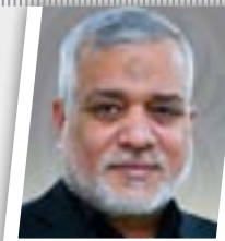
10 ملايين دولار شهرياً أرباح بعض المصارف من مزاد العملة