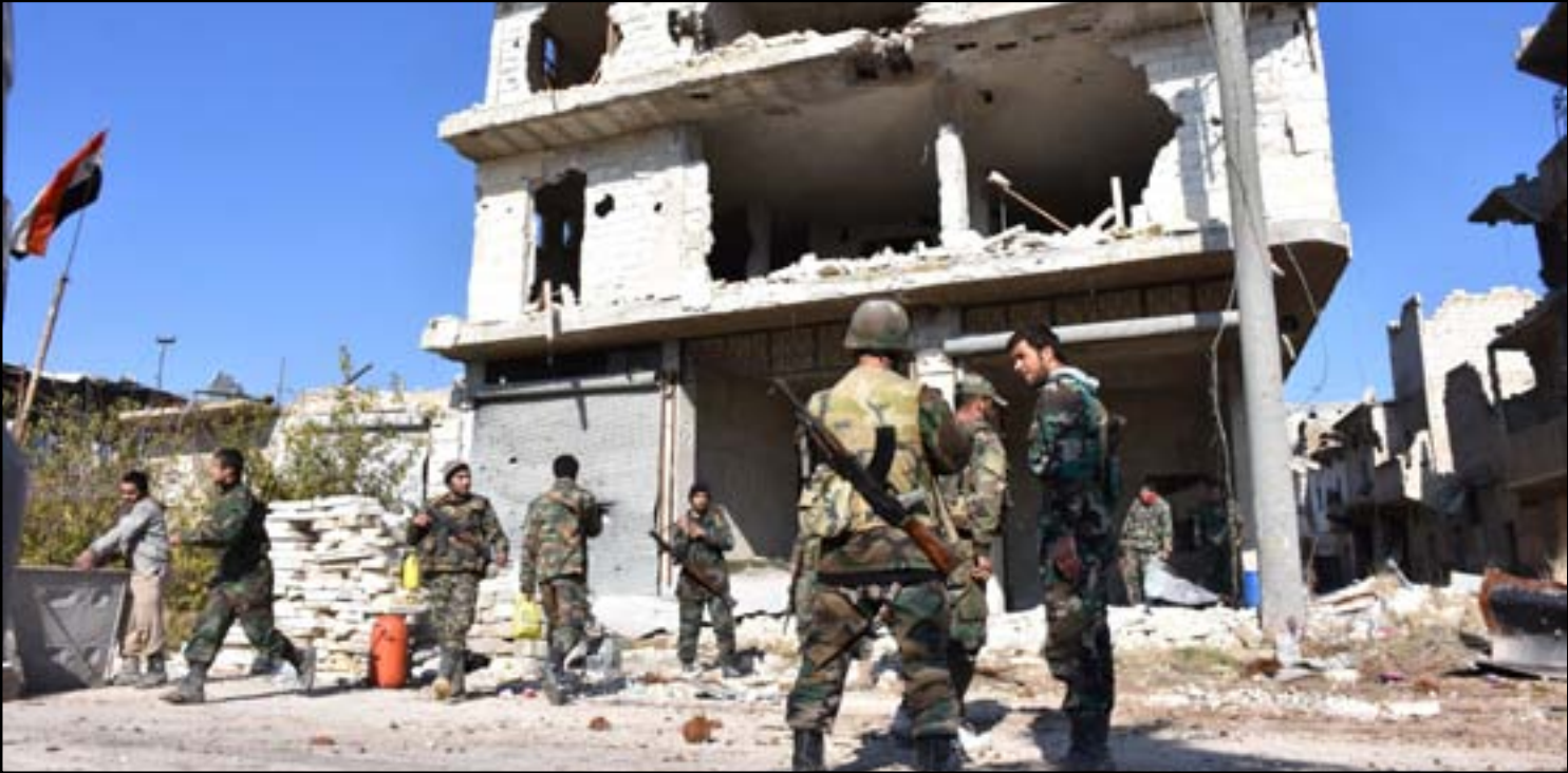
القوات الموالية للحكومة السورية تجتمع في منطقة شرق حلب...

روسيا تسعى لانسحاب كامل لمقاتلي المعارضة من حلب