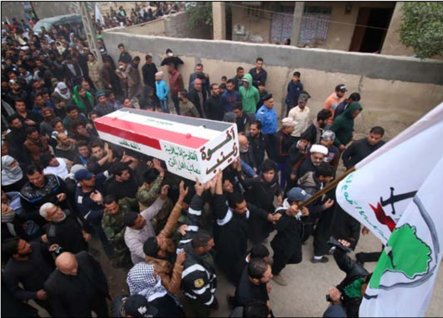
تشيع مقاتل في الحشد قتل بمبارك الموصل..