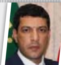
قريباً سنكشف عن ملفات فساد ضد وزير التربية والإعمار

وأضاف عضو اللجنة المالية أن "هذه المصارف سيطرت على مزاد العملة حتى وصلت الأرباح الى شكل غير منطقي"، مشيراً إلى أن "بعض المصارف الأهلية وصلت أرباح الواحد منها الى ١٠ ملايين دولار في الشهر الواحد تذهب بها الى خارج العراق".