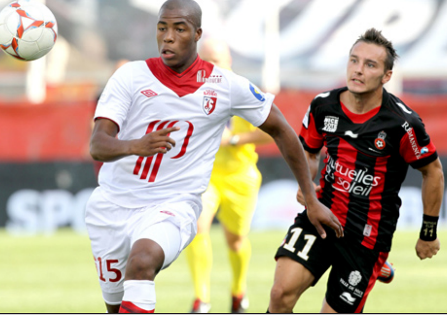
ليل يخرج بنقطة واحدة امام نيس