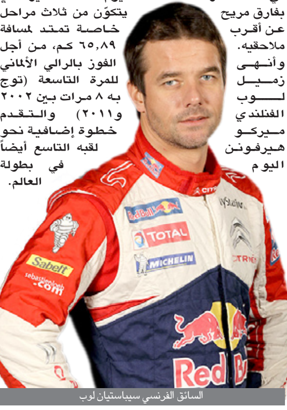
السائق الفرنسي سيباستيان لوب

□ برلين / أ ف ب أصبح سائق سبتروين الفرنسي سيباستيان لوب، بطل العالم في الأعوام الثمانية الأخيرة، على بعد نحو ٦٦ كم من الفوز برالي ألمانيا الذي يشكل هذا الموسم المرحلة التاسعة من بطولة العالم للراليات، للمرة التاسعة في مسيرته الأسطورية بعد أن أنهى اليوم الثاني في الصدارة بفارق مريح عن أقرب ملاحقيه. وأنهى زميل لوب به ٨ مرات بين ٢٠٠٢ و٢٠١١) والتقدم خطوة إضافية نحو لقبه التاسع أيضاً في بطولة العالم.