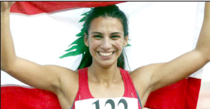
العداءة غريتا تثير الجدل

ولم يتم الاستماع الى إفادة اللاعبة، وبالدرجة الاولى اذا سلمنا جدلاً بان اللاعبة ارتكبت خطأ، فلماذا لم تنبه الى