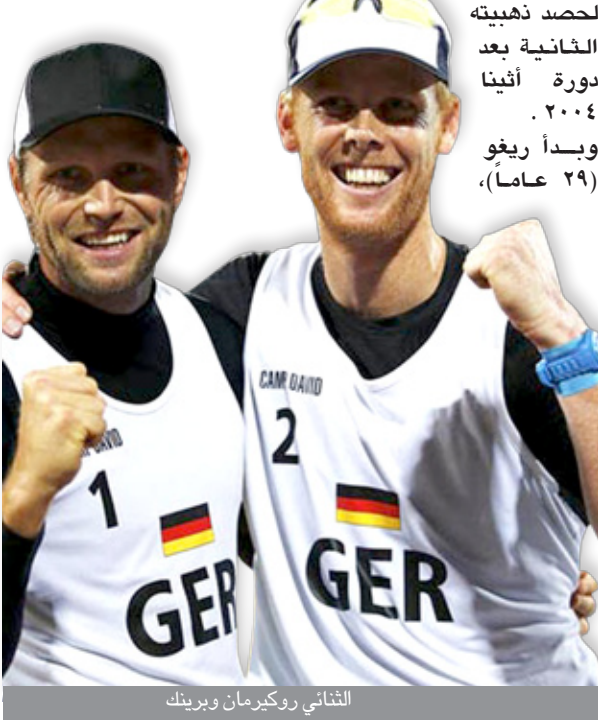
الثنائي روكيرمان وبرينك

وبذلك تفقد البرازيل ميدالية ذهبية جديدة بعد ان كانت مرشحة ساخنة لخطفها من قبل العديد من المتابعين لمسابقة كرة الطائرة الشاطئية نتجية للتناحج الرفيعة التي حققها منتخب الرجال خلال الفترة الاخيرة لتقف الى جانب منتخب السيدات لكرة القدم التي ما زال خروجها من دور الثمانية يحير الكثير من متابعي السامبا.