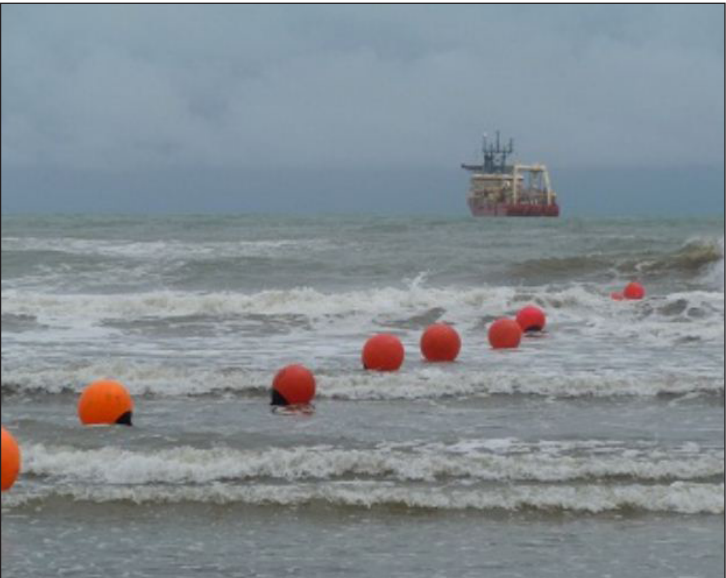
الكيبل الضوئي عبر شط العرب

الذي تساهم فيه مؤسسة قطر و صناديق الثروة الوطنية لعدة بلدان خليجية أخرى .