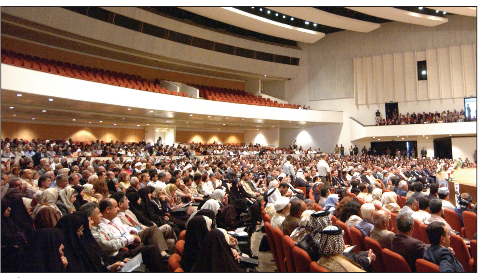
مجلس النواب .. (أرشيف)