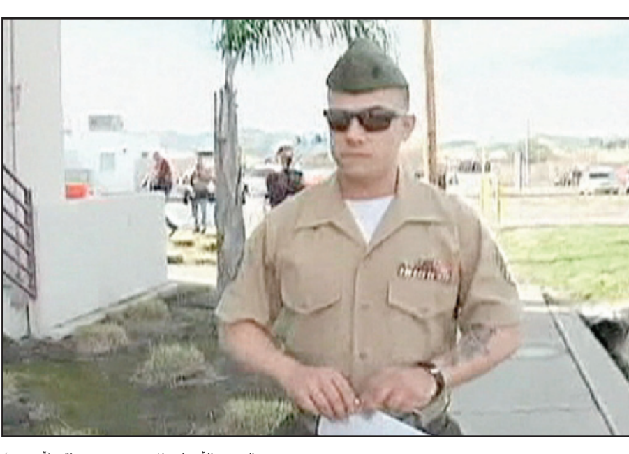
الجندي الأميركي المتهم بمجزرة حديثة..