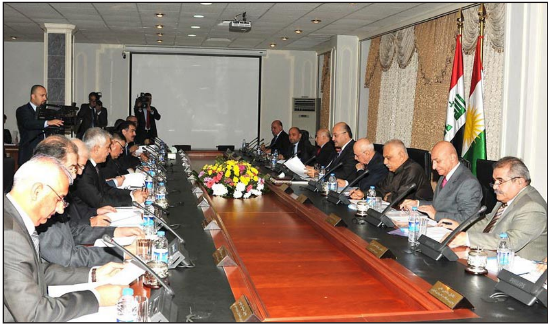
مجلس الوزراء الإقليم في أحد اجتماعاته.. أرشيف

وأضاف أمين إن "أحزاب المعارضة الكردستانية الثلاثة التغيير والاتحاد الإسلامي والجماعة الإسلامية أعلنت رسمياً عزمها على البقاء في المعارضة