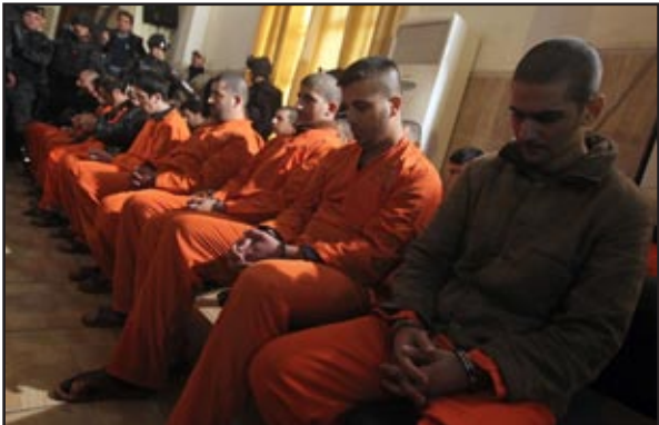
عدد من المتهمين باتمانهم لجماعات مسلحة..

من جانبه قال الوكيل الأقدم لوزارة الداخلية عدنان الأسدي، هذه خلال مؤتمر صحفي إن "هذه المجموعة اعتقلت قبل أسابيع في بغداد وتم الاحتفاظ بهم حتى إكمال التحقيقات والتجريات ومتابعة الأفراد الآخرين". وأكد أن هؤلاء "المتهمين ينتمون