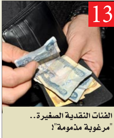
13 "مرغوبة مذمومة" .. الفئات النقدية الصغيرة ..