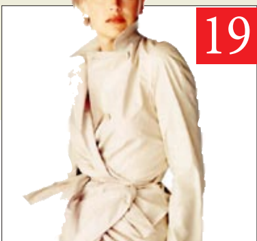
هل تنتهي صلاحية النجوم؟

http://www.almadapaper.net Email: info@almada-group.com