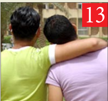
المثلية الجنسية موجودة بين الرجال والنساء