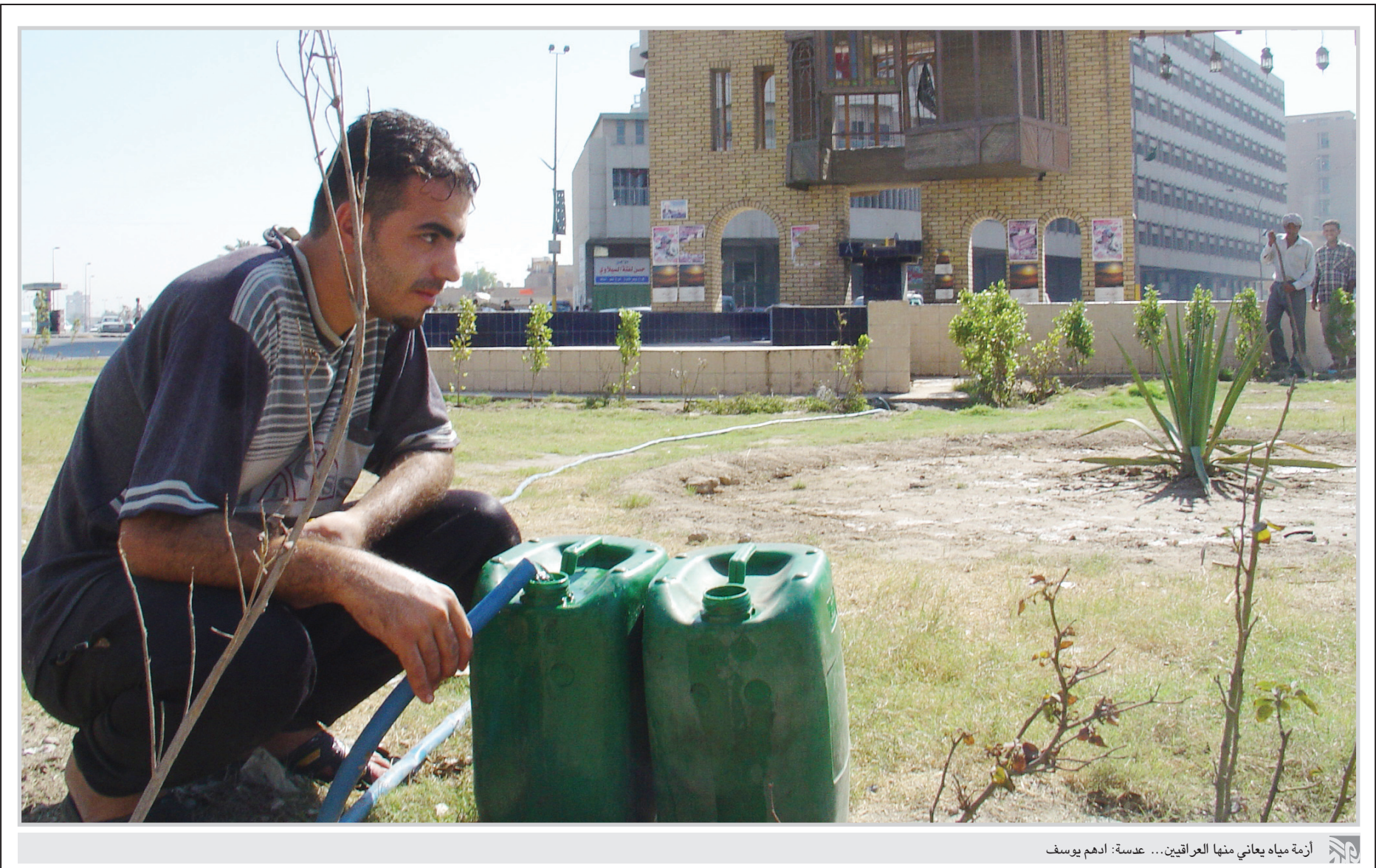
أزمة مياه يعاني منها العراقيين ...

وهناك، على حد علمي المتواضع، قرار ديواني بتوفير الكهرباء الوطنية ليلاً للجمععات السكنية التي تتجاوز طوابق العمارة الواحدة منها كذا طابق. وفي بغداد توجد مجمعات عديدة من هذا النوع تستفيد من هذا الأمر. مثل تلك الإشارات تدل على أن مشكلة الطاقة الكهربائية في العراق ليست كلها تقنية، ولا مادية، ولا فنية، الأصح أن نضيف عاملاً جديداً هو عامل المزاجية عند الجهات التي توزع الطاقة بين الأحياء والمناطق المختلفة في بغداد. السيد وزير المالية، رافع العيساوي، من جهته، وفي تصريحات تلفزيونية، ذكر أرقاماً مهولة صرفت خلال الأعوام الثمانية الماضية لتوفير الطاقة الكهربائية، ويبدو واضحاً أن ما صرف من مبالغ، سواء أكانت من نفقة الدولة أو من جيب المواطن، يراد لها أن تستمر. بمعنى أن قدرة العراق على توفير الكهرباء مادياً وتقنياً موجودة بالفعل، والدليل هذه المزاجية في وصول التيار الكهربائي بشكل مستمر وفي عز الصيف إلى مناطق معينة، ثم انقطاعها المفاجئ عن مناطق أخرى. وبالرغم من تلك القدرة فالأرجح هو استمرار التذبذب في أداء الكهرباء الوطنية، لأنها إلى الآن في مرحلة التجريب الذي يوصل كثيرين من حالة الفقر المدقع إلى الثراء غير المحدود.