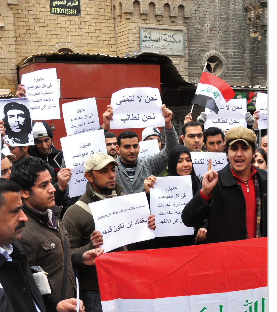
مثقفون وطلبة جامعيون يتظاهرون في شارع المتنبي أمس..

الدولة، وخصوصا المكاتب الرفيعة، لا يتم إلا من خلال وسائط عائلية ووسائط رشاوى فاسدة، وكان عدد من المحامين العراقيين أكدوا فى وقت سابق أن الموظفين المعينين بهذه الطريقة لن يخلفوا سوى المزيد من الترهل في مؤسسات الدولة.