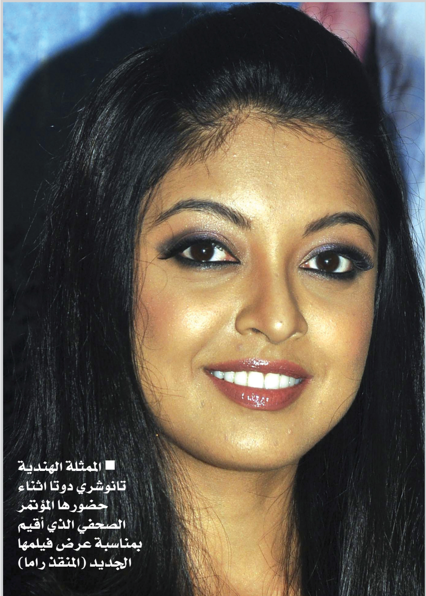
■ الممثلة الهندية تانوشري دوتا اثناء حضورها المؤتمر الصحفي الذي أقيم بمناسبة عرض فيلمها الجديد (المنقذ راما)