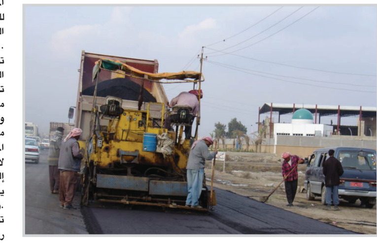
حملة لتبليط الشوارع .. تصوير: ادهم يوسف

في الاقضية والنواحي التابعة للمحافظة. وتهتم دائرة الرعاية الاجتماعية للمرأة التي تأسست في ١٣ آذار ٢٠٠٩ بشرائح الأرامل والمطلقات وزوجات المفقودين والمعاقات بدنيا بنسبة عجز ٧٥٪ والمسنات من عمر ٦٠ عاما فما فوق فضلا عن يتيمات الأبوين واسر نزلاء السجون المحكومين بأكثر من سنة واحدة . حيث يخصص ١٠٠ ألف دينار كراتب شهري للمستغيدة يضاف لها ١٥ ألف دينار عن كل قاصر مكلفة بإعالته وحتى خمسة أفراد بحيث يصبح مجموع الراتب للمستفيدة مع خمسة أفراد قاصرين ١٧٥ ألف دينار. فيماً يخصص راتب شهري قدره ٥٠ ألف دينار للمرأة العاجزة بسبب الشيخوخة.