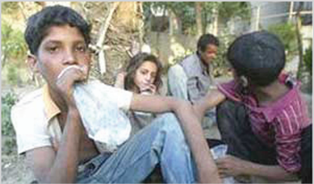
عسدة/ ف أب