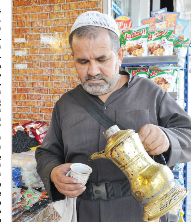
قهوجي جوال في بغداد

كشف نواب قياديون يشرفون على عملية التفاوض داخل التحالف