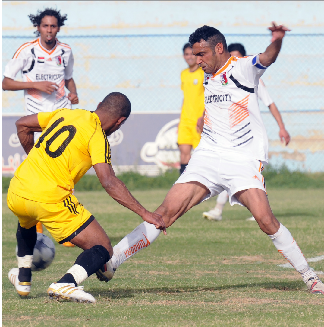
اربيل حسم موقفه في المربع الذهبي