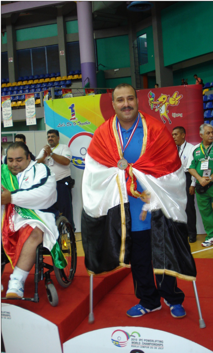
البطل الاولمبي فارس سعدون

فارس سعدون يقارع أصحاب الأوزان الكبيرة ويرضى بالبرونزية