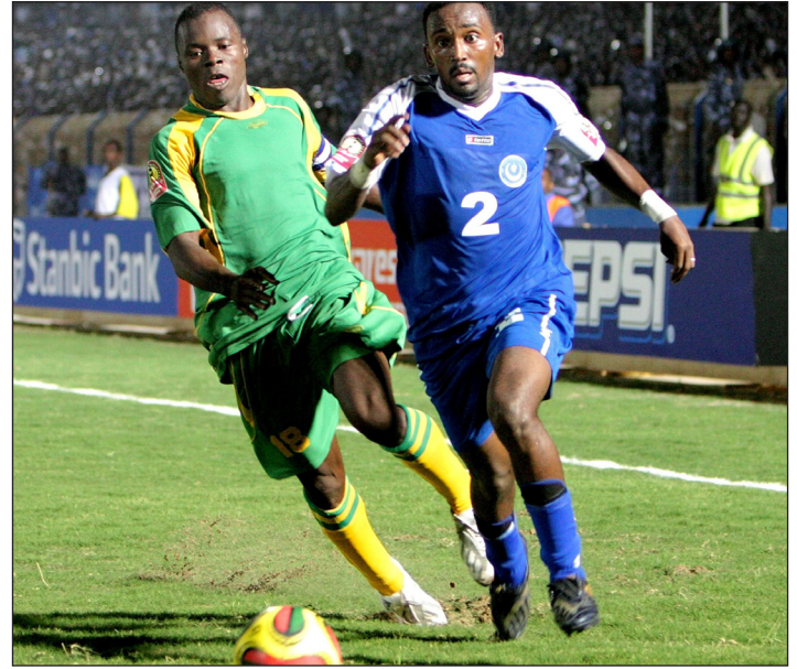
الكرة السودانية تواجه خطر الاتفاق