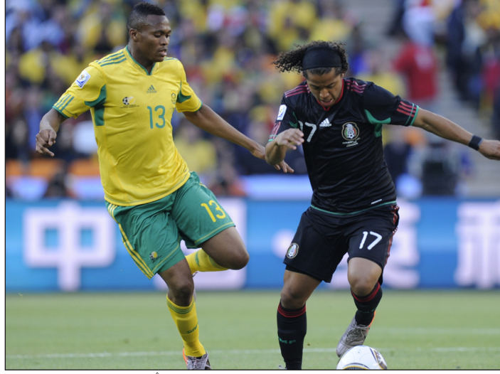
المكسيك المستفيد الأكبر في تصنيف فيفا الجديد

والمكسيك (٢٥)، هبطت مركزاً واحداً) ولم تكسب كولومبيا (٣٦) وبوليفيا (٥٠) إلا عدداً قليلاً من النقاط، ولكنه كان كافياً لتصعد كل منهما ثلاث درجات، بينما كانت السلفادور (٨٦)، صعدت ٤ مراكز) وناميبيا (١١٥)، صعدت ٤ مراكز) ونيو كاليدونيا (١٥٤)، صعدت ٨ مراكز) هي المنتخبات الوحيدة التي صعدت أكثر من ثلاث درجات. وقد عادت المنتخبات الوطنية للعمل في اليوم الذي نُشر فيه هذه النسخة من التصنيف العالمي، حيث أُقيمت أكثر من ٥٠ مباراة ودية يوم ١١ من الشهر الجاري (يشترك فيها ٢٢ فريقاً ممن خاضوا منافسات كأس العالم ٢٠١٠ وتشهد ٧ مباريات منها مواجهات مباشرة بين منتخبات ودعت جنوب أفريقيا منذ أسابيع قليلة، وهو ما