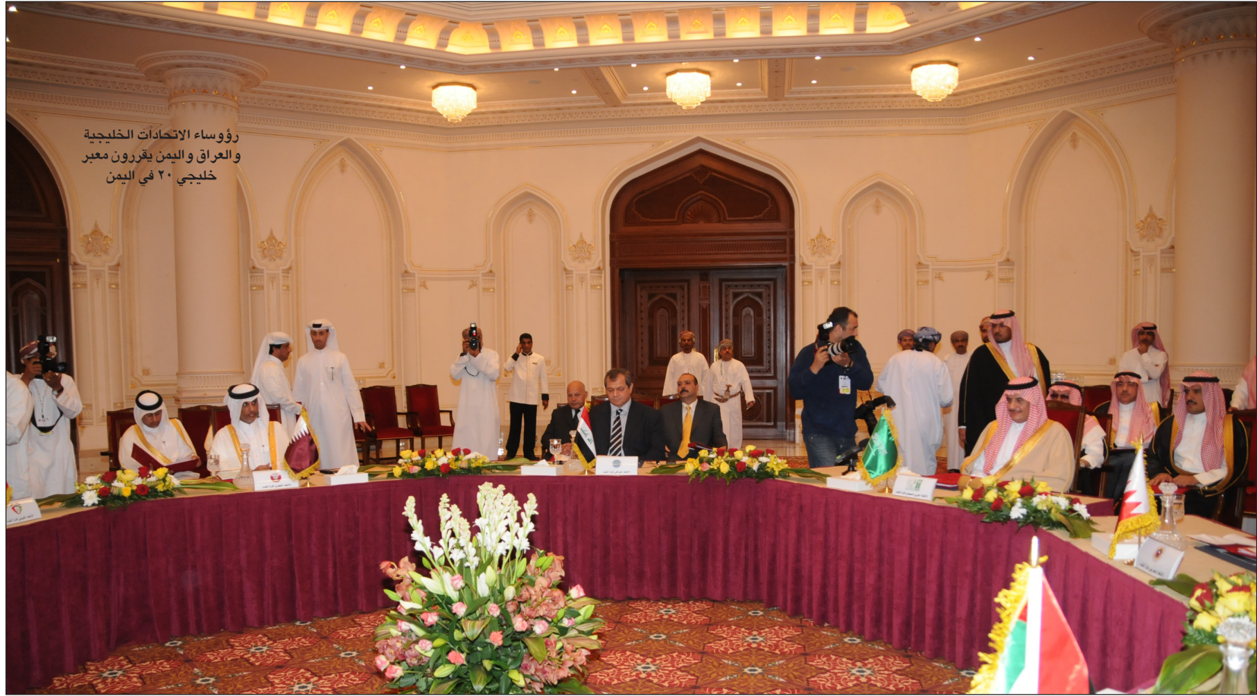
رؤساء الاتحادات الخليجية والعراق واليمن يقررون معبر خليجي ٢٠ في اليمن

كبيرة من الحرس الجمهوري لتأمين البطولة، وذلك وفق الخطة الأمنية المعتمدة من اللجنة التحضيرية العليا للبطولة.