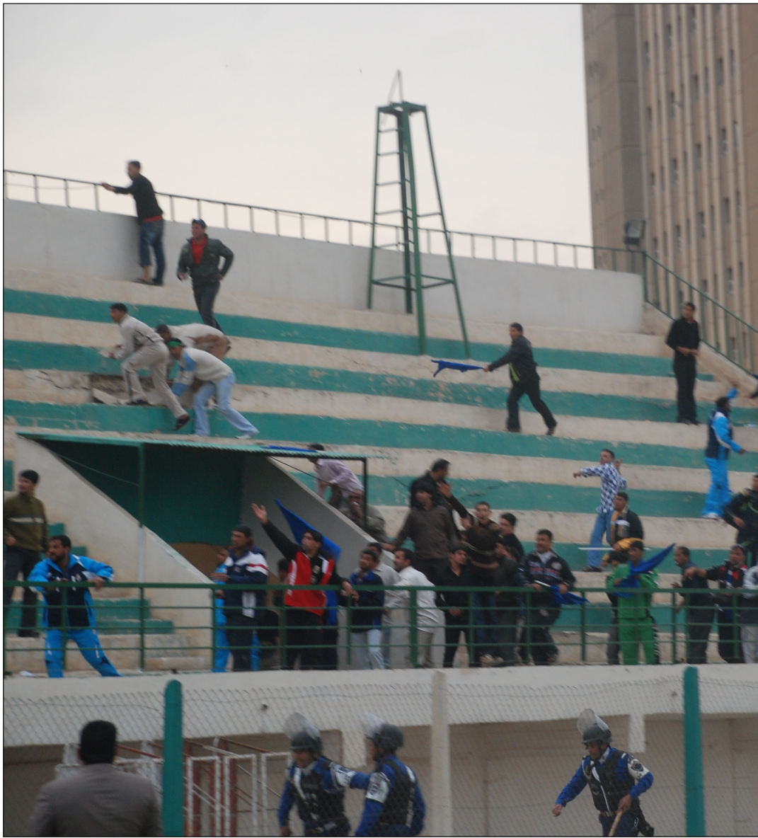
ظاهرة الشغب تستفحل في الملاعب

ويعتمد فريق كربلاء في طريقة لعبه على عمل الزيادة العددية في منتصف الميدان والتنظيم الدفاعي الجيد ونقل الكرة السريع من اللمسة الاولى الى المهاجمين واخطار الرمي من الجانبين والابتعاد عن المراوغة غير المجدية في محور العمليات ، لذلك فان زكي بغض النظر عن انتقال فريق القباب الذهبية الى المربع الذهبي فإنه نجح مع الفريق بدرجة امتياز واعاده الى دائرة التنافس بعد تضائل اماله في منافسات الدوري .