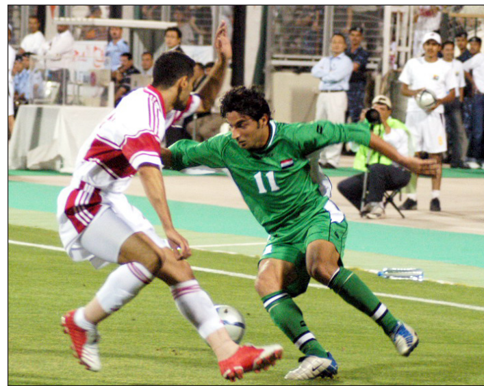
لقطة من مباراة العراق والاردن في بطولة غرب آسيا

عمان / وكالات أكد أمين عام اتحاد دول غرب آسيا لكرة القدم فادي زريقات، أن النسخة السادسة لبطولة غرب آسيا للمنتخبات الوطنية التي تضيفها العاصمة الأردنية عمان، خلال الفترة من ٢٤ ايلول إلى ٣ تشرين الأول المقبلين، نقلة نوعية وكبيرة لاتحاد غرب آسيا وأنشطته وبطولاته، مشيراً إلى أنها خير استعداد لكأسي الخليج وآسيا المقبلين. وكشف أن انضمام البحرين والكويت واليمن وظهورها الأول في البطولة سيعطي النسخة السادسة «قيمة إضافية بل وتاريخية». وكانت قرعة البطولة التي سحبت في عمان الشهر الماضي شهدت إعلان ارتفاع عدد المنتخبات المشاركة إلى (٩) وزعت على ثلاث مجموعات، ووضع منتخب إيران (حامل اللقب) على رأس الأولى مع البحرين وعمان، ووضع منتخب الأردن على رأس الثانية مع سورية والكويت، ومنحت القرعة منتخب العراق بطل آسيا صدارة المجموعة الثالثة التي ضمت كذلك اليمن وفلسطين.