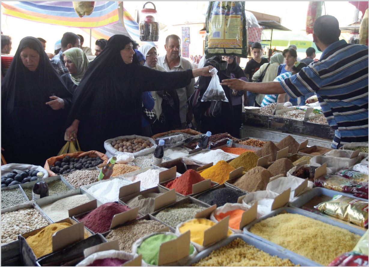
حركة في الاسواق استعدادا لشهر رمضان

الجلسة وفي حال الاستمرار على هذا الحال سوف نطالب باعادة الانتخابات والتأكيد على ضرورة اشراك المرأة في المباحثات. ادور بينت ان من بين المشتركين في الاعتصام نساء جددتن عن واقعهن المرير، وقالت: ليس من