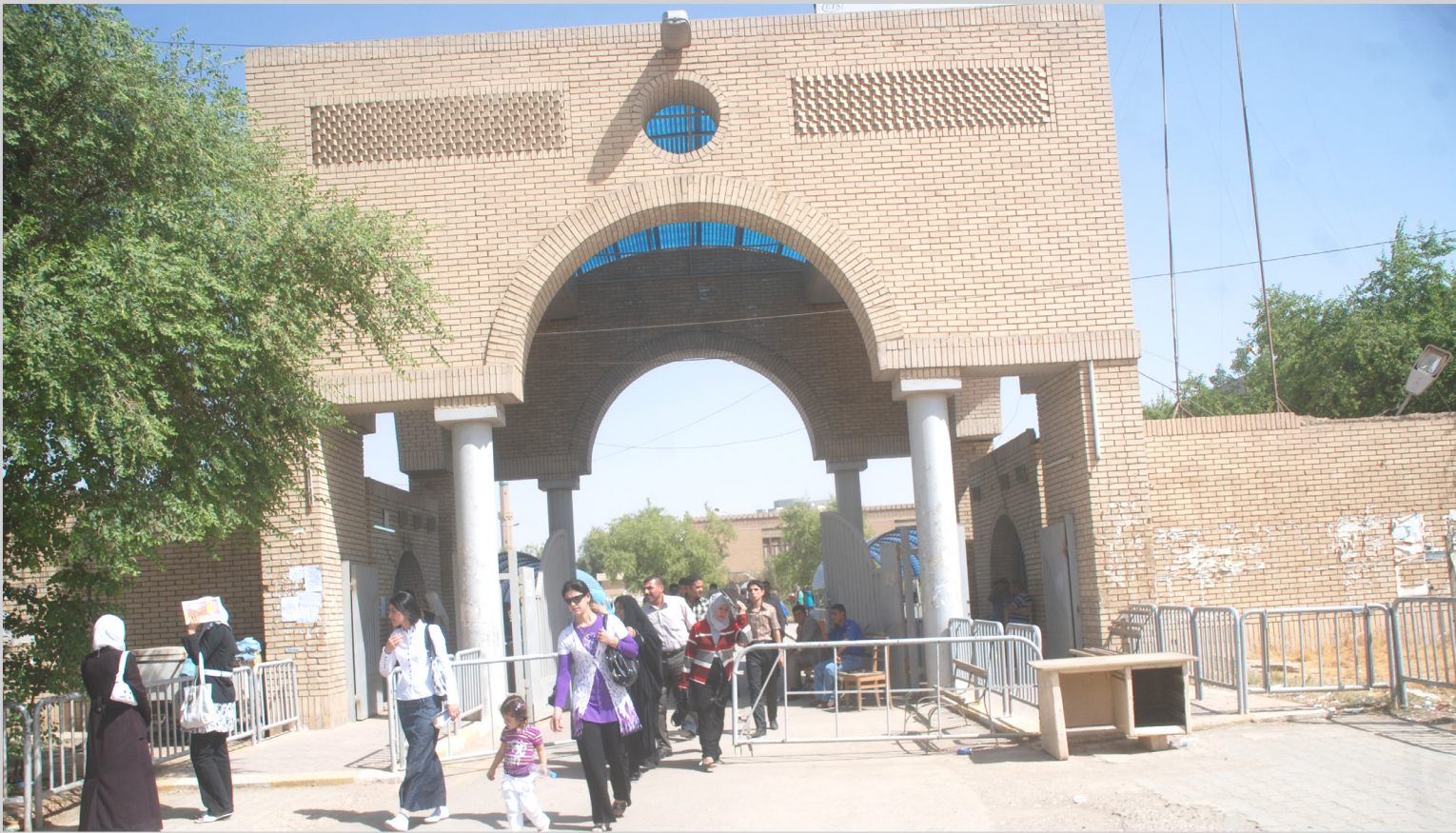
الجامعة مصدر الشهادة .. عذسة: سعد اله الخالدي

بإدراج عقوبتين : العقوبة الأولى : استخدام المحرر المستخدم القائم بعملية التزوير مثلا وثيقة مزورة في حالة اكتشافها فان حامل الوثيقة يعتبر أمام القانون مجرماً يعاقبه القانون، ومن قام بالفعل ايضاً يعاقب بالسجن ثلاث سنوات. العقوبة الثانية : استخدام المحرر المزور بمعنى الذي قام بالتزوير يعاقب بجريمة محرراً زائداً مضنون والعقوبة لا تقل عن ثلاث سنوات ايضاً.