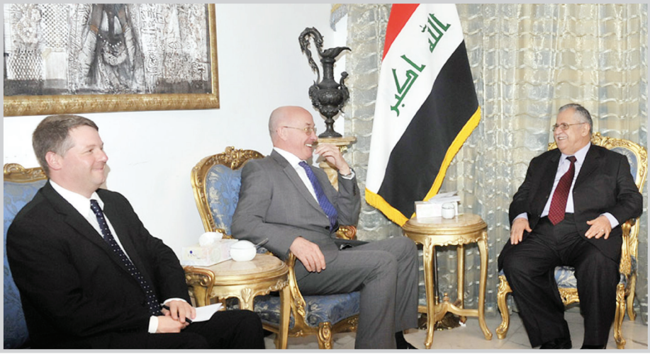
ثناء لقائه السفير البريطاني

مبينًا طبيعة ومسار الجهود التي تبذل من أجل تشكيل الحكومة المقبلة. وأوضح الرئيس طالباني أثناء اللقاء، أهمية دور التحالف الكردستاني على الساحة السياسية العراقية مبينًا أن الكرد كما في المرحلة السابقة يقومون بتقريب وجهات النظر وترسيخ الوئام الوطني والتلاحم بين مكونات المجتمع العراقي. وأشار رئيس الجمهورية إلى أهم المهام الملقة على عاتق المسؤولين الكرد في بغداد، منها العمل الدؤوب لضمان احترام الدستور العراقي، والالتزام بتنفيذ مواده وبضمنها المادة (١٤٠)، فضلاً عن تطوير التحالفات الموجودة مع القوى الفاعلة والدفاع عن العراق الديمقراطي الاتحادي الحر والمستقل. هذا واستعرض عدد من المسؤولين الكرد تصوراتهم وأراءهم بشأن معالجة المشاكل العالقة وتقوية الأداء الكردي ضمن المشهد السياسي.