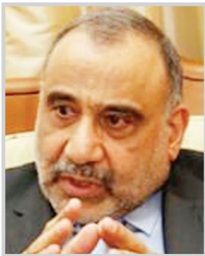
عادل عبد المهدي

شدد نائب رئيس الجمهورية عادل عبد المهدي على ان المرشح المقبل لرئاسة الحكومة "يجب ان يتمتع بشروط ومواصفات اهمها ان يكون مقبولا ونظرة النقاء، وان يكون مستقلا في قراراته عن أية تأثيرات خارجية، وان يتصفى من الاسباب المؤثرة ربما ستلعب دور ورقة خسارة تجذب