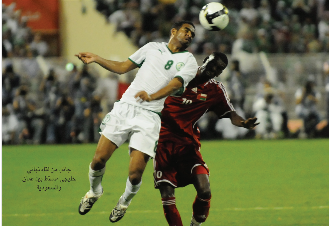
جانب من لقاء نهائي خليجي مسقط بين عمان والسعودية

وأشار إلى أن اللجنة الثلاثية ستتجول ميدانيا لمعرفة الأجواء بدقة وتلقي كل التفاصيل عن الاستعدادات من اللجنة المنظمة.