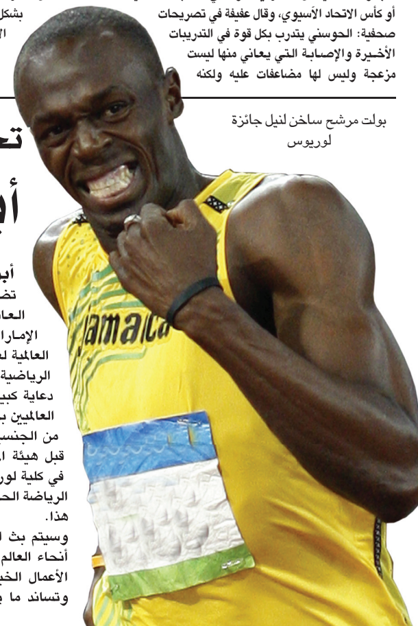
بولت مرشح ساخن لنيل جائزة لوريوس