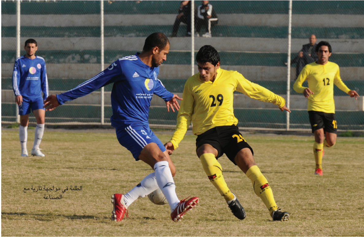
الطلبة في مواجهة تارية مع الصناعة