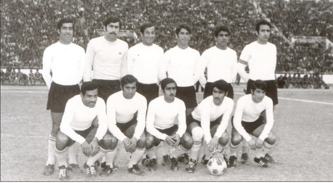
يتوسط منتخبنا عام ١٩٧٣ في تصفيات مونديال ألمانيا