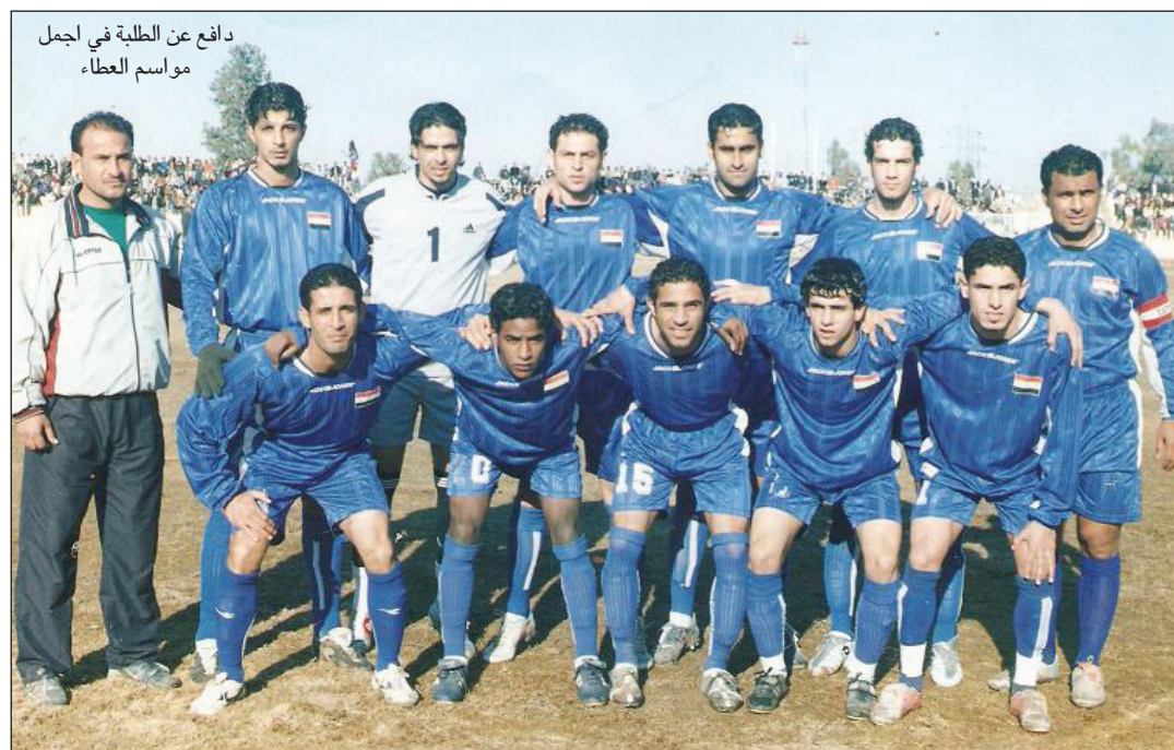
دافع عن الطلبة في أجمل مواسم العطاء