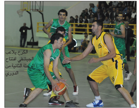
الكرخ يلعب الجيش في افتتاح المرحلة الثانية من الدوري

وكان لقاء الذهاب قد حسمه فريق التضامن لمصلحته بواقع (٧٧ - ٧٢) فيما ستكون محافظة البصرة شاهدة على لقاء فريقها السلوي نبط الجنوب مع ضيفه فريق الشرطة الذي يحاول تكرار فوزه في المرحلة الأولى بواقع (٧١ - ٦٢) فيما قرر الاتحاد تأجيل لقاء فريق دھوك مع ضيفه الحلة المقرر إقامتها في قاعة كلية التربية الرياضية بجامعة دھوك نتيجة لدخول الأول في معسكر تدريبي يقام حالياً له في تركيا استعداداً لمنافسات بطولة غرب آسيا التي ستقام في العاصمة الإيرانية طهران الشهر المقبل.