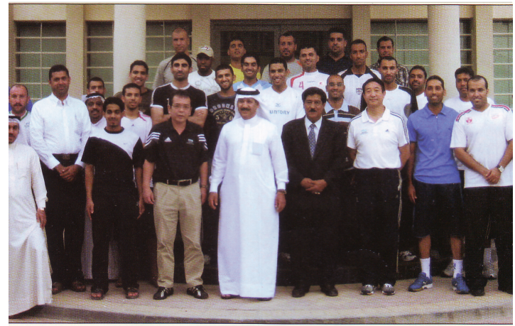
جانب من المشاركين في دورة البحرين

تحقق في تلك البطولة من نتيجة يعد فرصة للعراق خاصة وان اللاعبين اعمارهم صغيرة وينتظرهم مستقبل كبير.