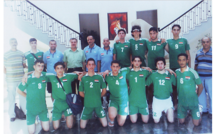
منتخب الناشئين اثناء مشاركته في بطولة عربية

- بعد تدارس الملاك التدريبي تم تجاوز اسباب الخسارة ولعبنا بروحية وتجاوزنا المنتخبات الاربعة المتبقية ونلنا المركز الأول عن مجموعتنا عندما تغلبنا على الإمارات (3-0) وعلى البحرين (3-1) وعلى السعودية (3-2) وعلى لبنان (3-1) وبعدها خسرننا بشرف مع مصر بنتيجة (3-2). × ولكنكم لم تنجحوا في كسب المنتخب السعودي في مباراة تحديد المركزين الثالث والرابع في البطولة؟