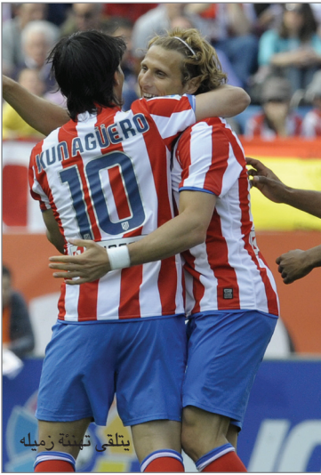
يتلقى تينكو زميله

– لقد أصبح لقب كأس الملك أولى أولوياتنا، من دون إغفال رغبتنا في الفوز بكأس دوري أوروبا، التي دخلت منافساتها مراحلها الحاسمة، أما في الدوري الإسباني، فيتعين علينا أن نستعيد توازننا وتحقيق نتائج منتظمة، وهو شيء عجزنا عن إدراكه حتى الآن، علينا أن نبدأ في جمع أكبر عدد من النقاط ثم بعدها سنقوم بتقييم الحصيلة وفق ترتيبنا بين أندية الدوري.