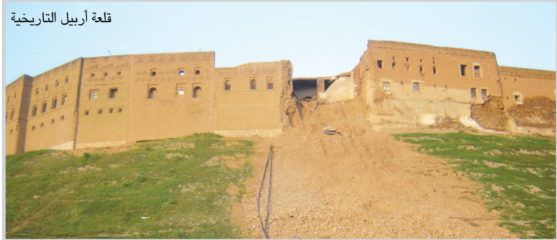
قلعة أربيل التاريخية

لم أشاهد رجلا واحداً يرتدي (التراكسود) في الشارع العام، بل كان الرجال في كامل أناقتهم وكذلك النساء بزيهن القومي خاصة في القلعة، كما وجدت التزاما كبيرا بأنظمة السير، فالسائبة يسرون على الأرضة لعدم وجود تجاوزات على