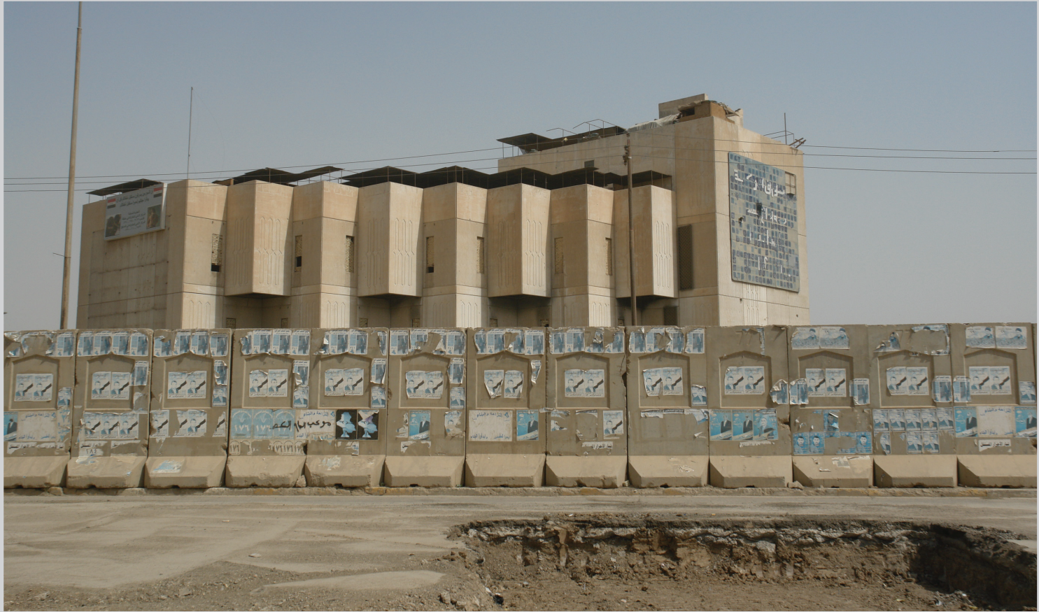
تجاوزات أمنية على موقع في بغداد

العائدة للدولة في بغداد لمتختلف الأغراض والاستخدامات الا بعد الحصول على الموافقات الرسمية والأصولية من اللجنة العليا للتصميم الأساس المشكلة في أمانة بغداد للنظر بطلبات تغيير جنس واستعمال الأرض حفاظا على جمالية العاصمة صاحبة الإرث الحضاري والتاريخ الكبير.