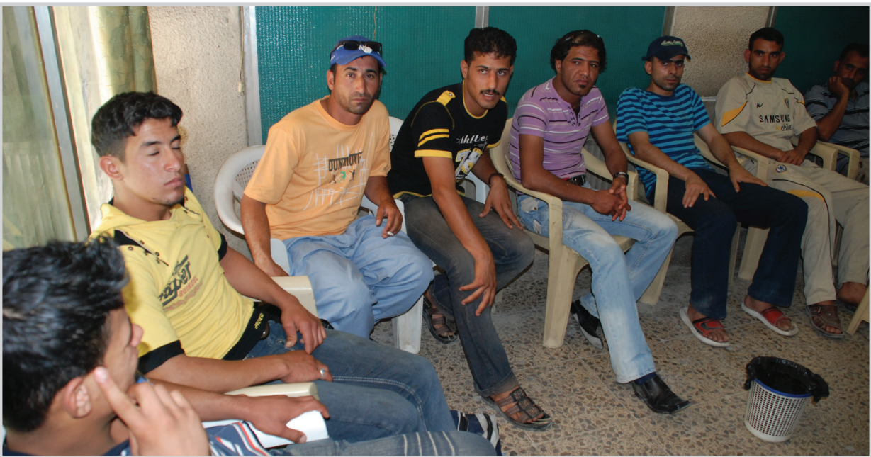
شباب ينتظرون أوامر التعيينات

المخصصة من وزارة النفط للشركة المذكورة التي حشرت التقديم على التعيينات بسكنة البصرة فقط.