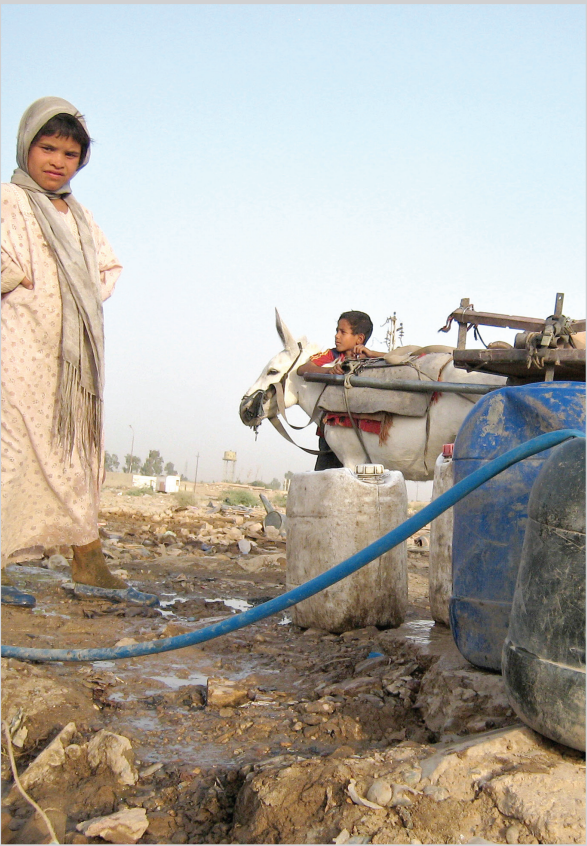
من مناطق شرقي بغداد

وأوضح بيان المكتب الإعلامي للأمانة تلقت المدى أمس نسخة منه أن أمين بغداد وجه بإحالة وتوقيع عقد مشروع إكساء محلة (٧٦٥) كما دعا الشركات المتخصصة في مجال الإكساء وتطوير الطرق إلى المشاركة في المناقصة الخاصة بإكساء محلة (٧٥٩) التي تعد ثاني أكبر محلة سكنية بعد المحلة (١٠١) في منطقة البتاوين كما وجه بحسب البيان بتهيئة عدد من السيارات الحوضية لنقل الماء الصافي إلى المناطق التي تعاني الشحة ليتم توزيعها بإشراف ممثلين عن أهالي هذه المناطق كحل سريع ومؤقت لحين إنجاز المشاريع الكبيرة التي ستحل الشحة بشكل نهائي وتوفر لهذه المناطق كامل احتياجاتها من الماء الصالح للشرب . وأضاف البيان "أن المدراء العامين لدائرتي ماء ومجاري بغداد إستعرضوا أهم المشاريع التي تنفذ والجهود التي من شأنها خدمة هذه المناطق وحل جزء من مشاكلها، ففي مجال الماء أكد مدير عام دائرة ماء بغداد إنشاء عدد من المجمعات لإنتاج الماء الصافي بعضها خدم بشكل رئيس محلاتي (٧٦١، ٧٦٧) وكذلك نصب (٤) مجمعات للماء الصافي في منطقة حي المعامل ومجمعين آخرين في