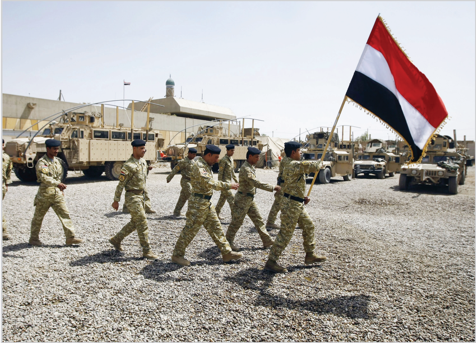
جنود عراقيون يحملون علم البلد استعدادا لتسلم المهام الامنية.. ا ف ب

عليهم بالجرم المشهود.و أوضح المصدر: "أنه تمت إحالة أوراق المتهمين إلى القضاء ليتألوا جزاءهم العادل على هذه الجرائم التي تسبى للبلد واقتصاده.ولم يوضح المصدر حجم المبالغ التي تم إنخالها للسوق عبر هذه العصابة لكنه أكد أن المبالغ التي زورتها تلك العصابة كانت مختلف فئات العملة العراقية والتحقيقات مازالت مستمرة لتأكد من أرقام المبالغ التي اسخلت الى السوق المحلية بطرق التزوير وتضليل البسطاء من اهالي المحافظة.