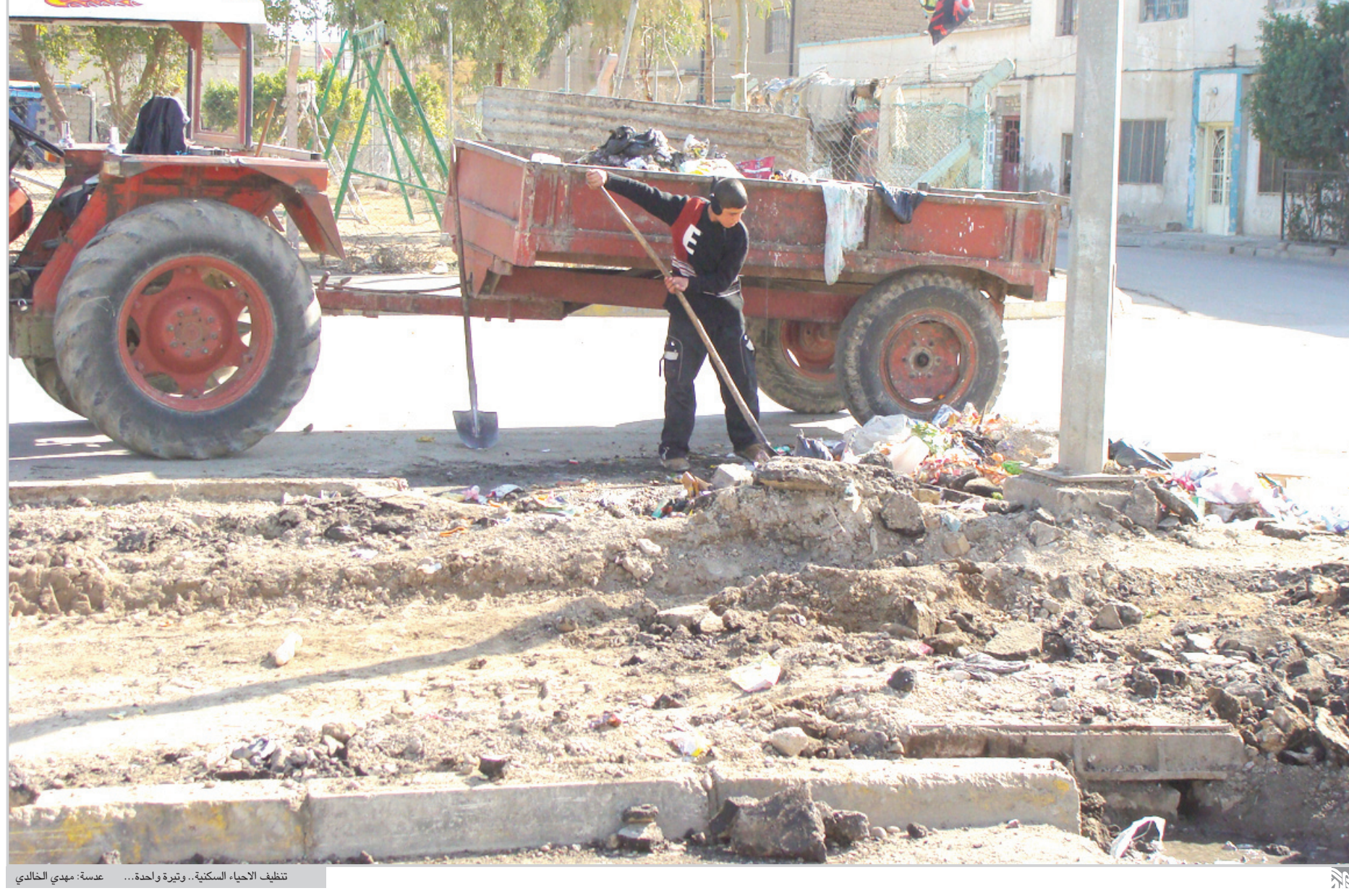
تنظيف الأحياء السكنية. وتيرة واحدة... عسدة-مهدي الحادي

بغداد/ المدي أعلنت دائرة الرعاية الاجتماعية عن تمديد فترة تسليم البيان السنوي للمشمولين بعائات شبكة الحماية الاجتماعية لغاية نهاية شهر حزيران لعام ٢٠٠٩. ذكر ذلك مدير عام الدائرة في بيان وأضاف ان فترة تمديد تسليم البيان السنوي جاءت تضامنا مع الشرائح المشمولة لتخفيف العبء عنها.