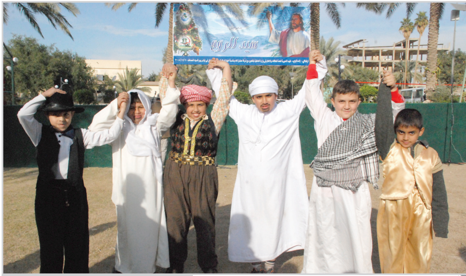
اطفال يدعون للحية والسلام خلال احتفال في بغداد... عسة، مهدي الخالدي

بشارت وزارة النقل بالتنسيق مع وزارة المالية تنفيذ مشروع المناطق الحرة حول مطار بغداد الدولي، فيما وقعت الوزارة منكرة تفاهم مع فرنسا في مجال تأهيل قطاع الطيران الجوي. وقال مستشار الوزارة