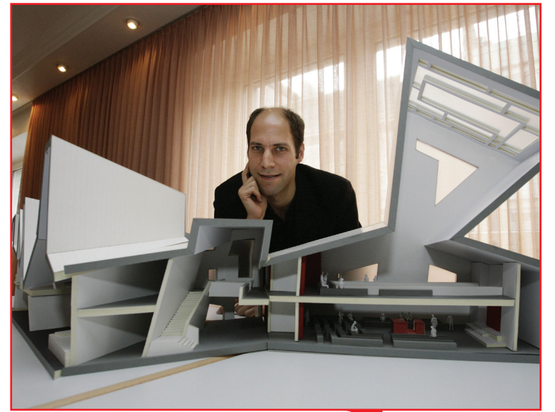
نماذج معمارية للمصمم الالماني مايكز للكنيس الجديد الذي سيقيم بدل الكنيس الذي دمره النازيون