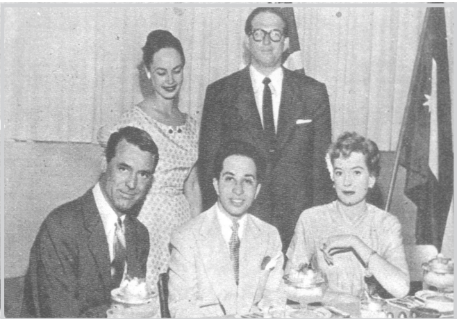
فيصل الثاني بينهم نجوم هوليوود ومنهم روبرت تايلور

نشرت مجلة آخر ساعة المصرية في عددها الصادر بتاريخ ١٩٥٢/١٠/٢٢ الخبر الآتي-